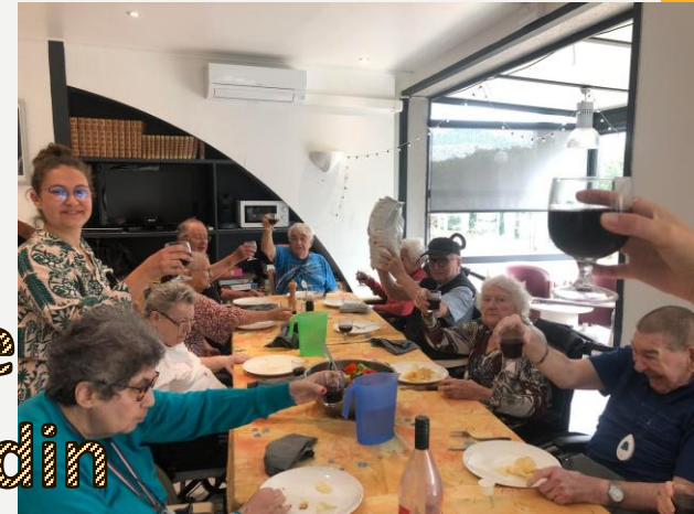
Cueillette salade Et aromates du jardin